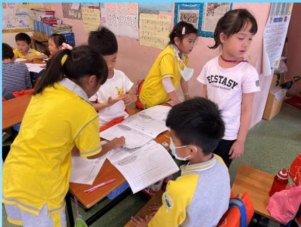
一開始讓學生對於春遊的討論