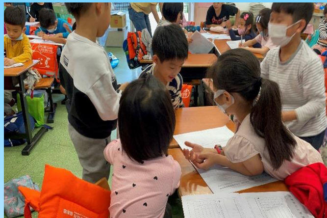
鼓勵學生發表意見，參加討論